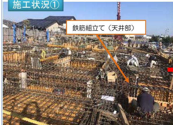
鉄筋組立て（天井部）