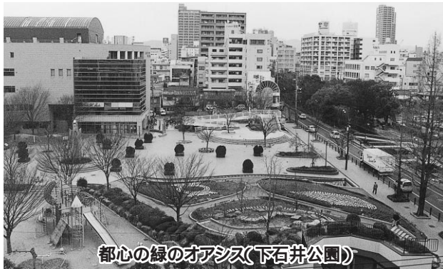
都心の緑のオアシス(下石井公園)

答 西川緑道公園に隣接する貴重な公園であり、都市の顔となる緑の拠点、大型イベント開