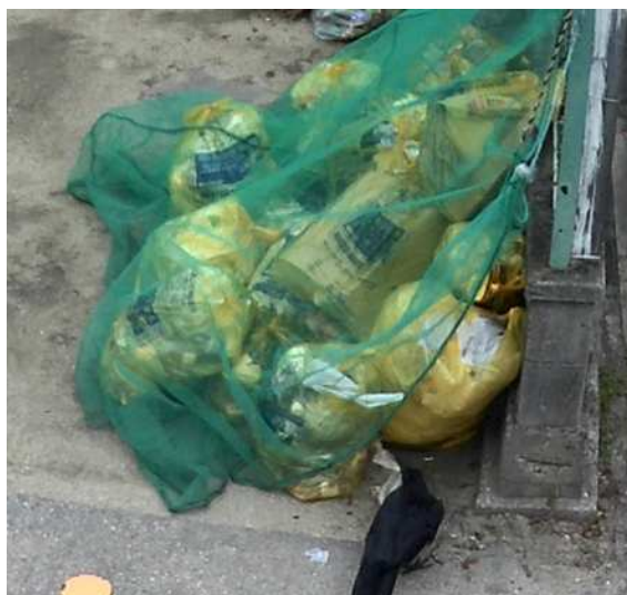
図5 ネットの隙間から突くカラス