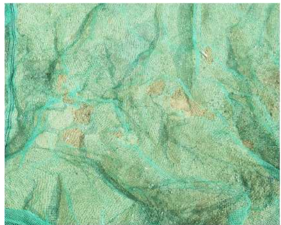
図6 防護ネットに多数の穴