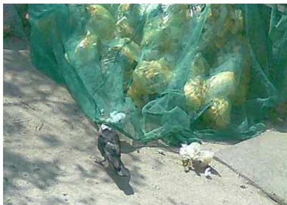
図3 ネットをめくるカラス