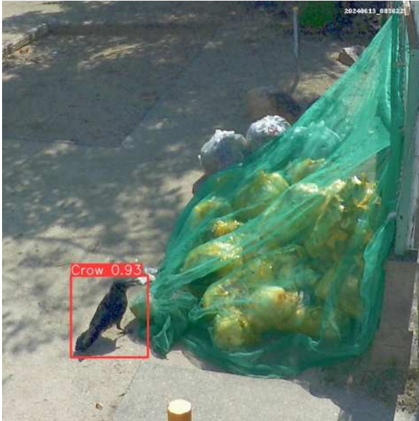
図 10 カラスを検出した画像

撮影した画像の中で、カラスが写っているものだけを検出し、カラスを赤枠で囲んだ画像と撮影時刻などを一覧にまとめたデータベースを出力させる。