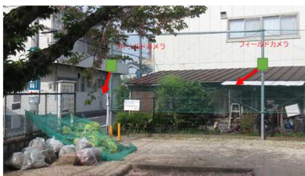
図1 フィールドカメラの配置