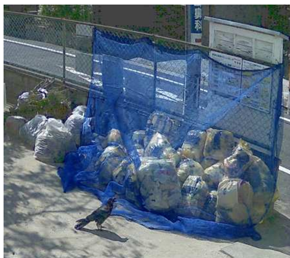
図8 様子見をするカラス