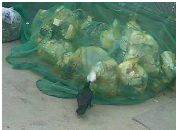
図4 ネットの穴から突くカラス