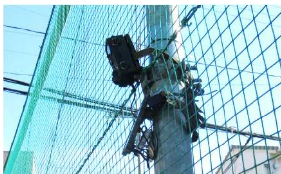
図2 フィールドカメラ