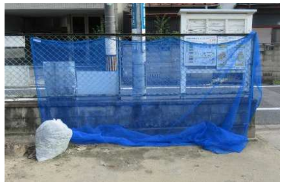
図7 交換した防護ネット