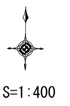
添付図3-1 配置図 (変更前)