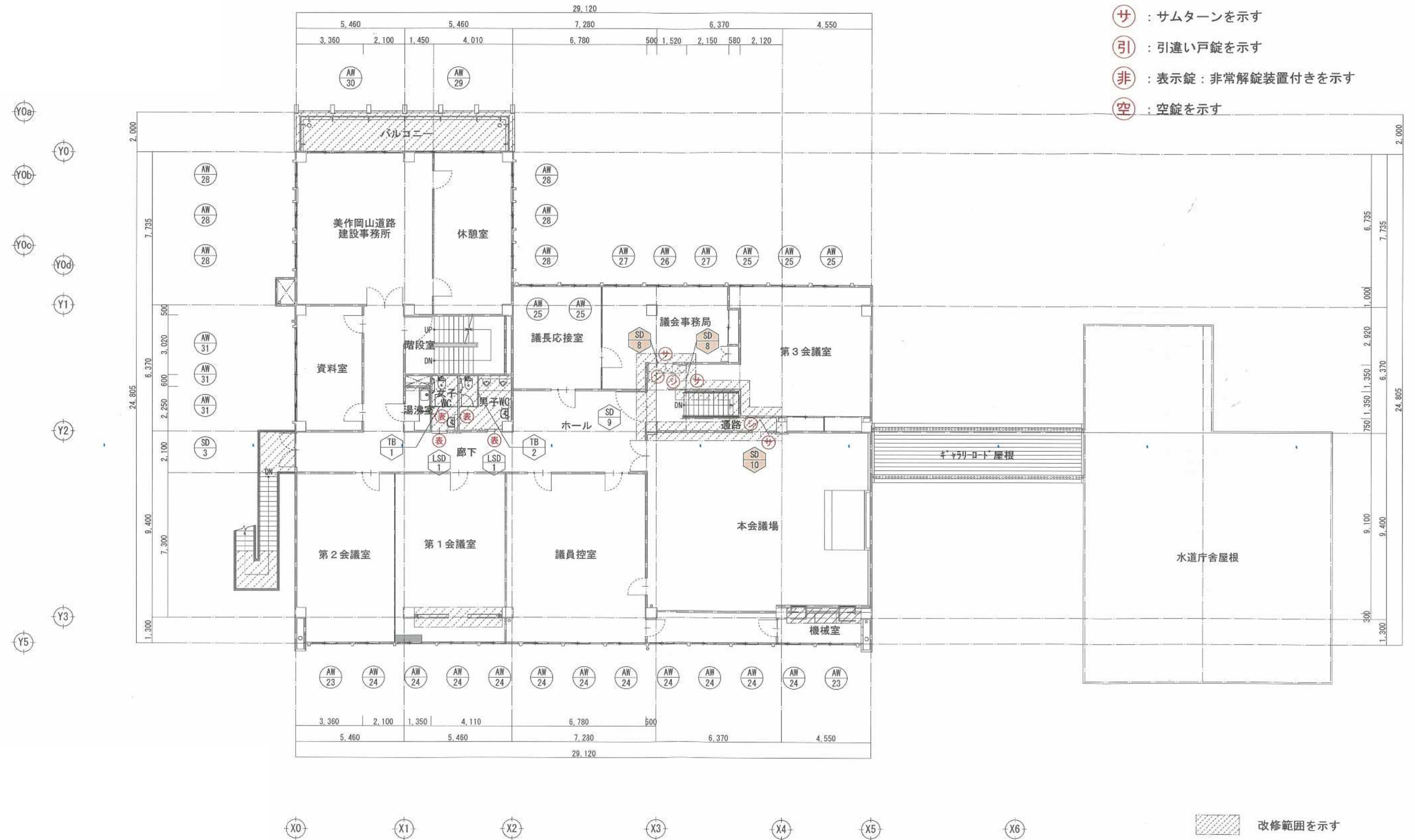
3階建具配置図 (改修後) 1/100