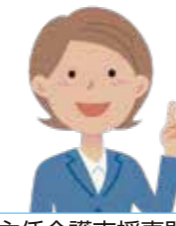
主任介護支援専門員 (主任ケアマネジャー)