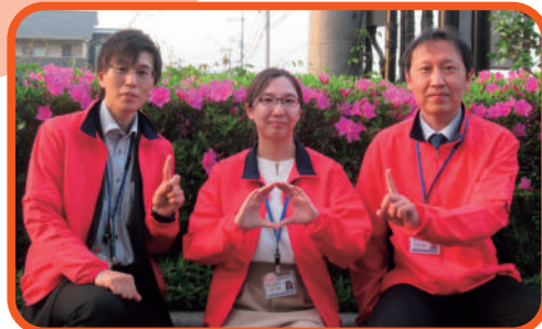
為房 大畑 山田