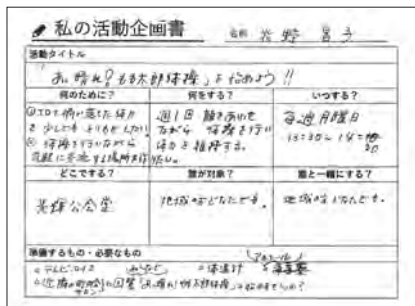
支えるみんなの活動講座で 作成した企画書

現在は週に1回開催しており、毎回約20名の方が参加しています。スタッフ、参加者を区別していないので、気づけば全員が準備片付けを手伝ってくれています。