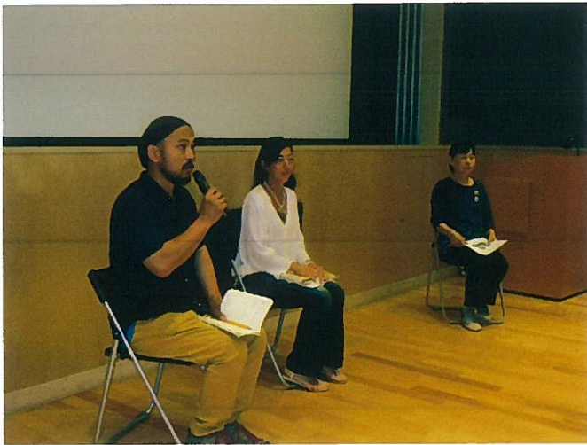
映画会アフタートーク