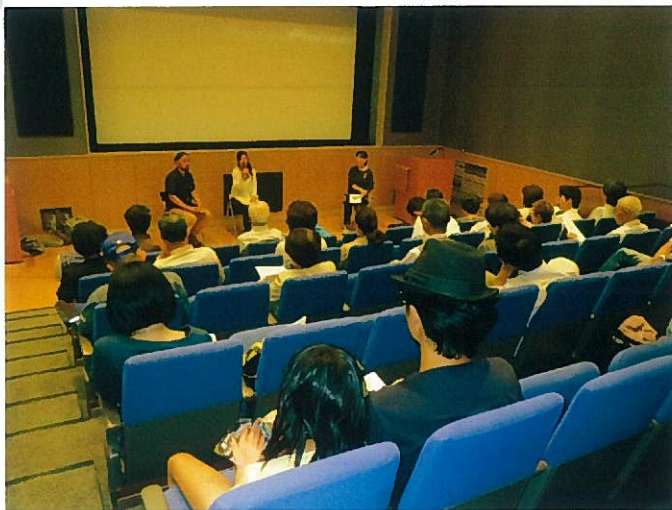
映画鑑賞の後の交流