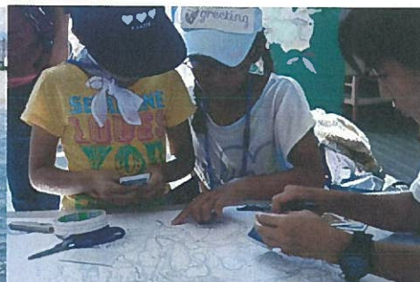
グリーンマップづくり