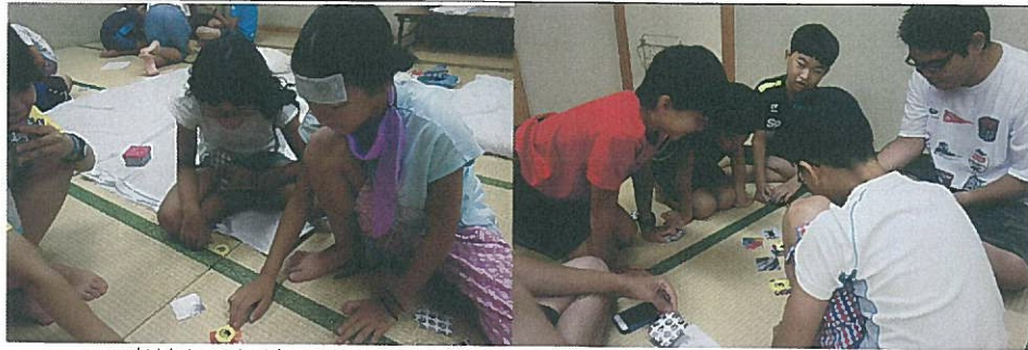
廃材カードゲーム