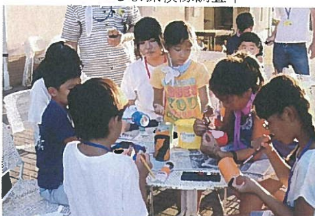
キャンドルホルダーづくり