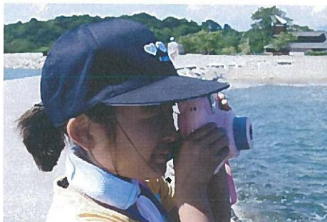
いぬじま探検隊調査中