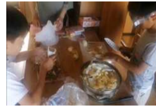
自炊を通じ遂行力や協調性を育てます

3歳児から小学6年生くらいの軽度の発達障がいの子どもとその保護者を対象としています