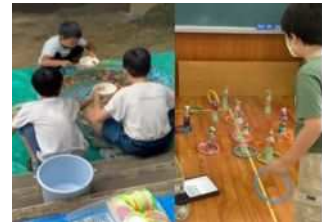
ルールに従い、競ったり協力します