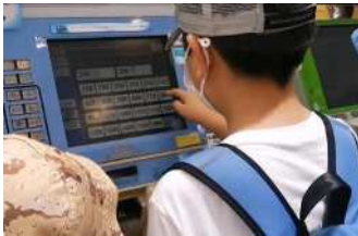
目的地までの経路を調べ切符を買います