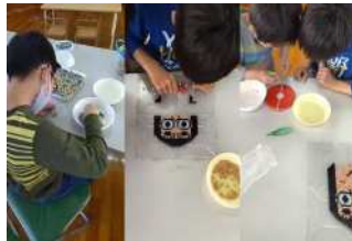
手先を使い、集中力と創造力を高めます