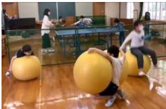
思い切り全身を動かして無心に遊びます