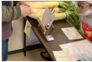
キッズカフェで接客体験をしました