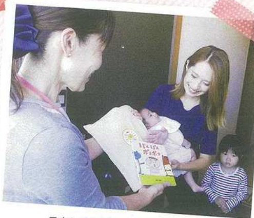
こんにちは赤ちゃん訪問の様子

愛育委員会は各小学校区・地区ごとに組織され、地域のみなさんへの「声かけ」や「見守り」を通じて健康で豊かなまちづくりを目指すヘルスポランティア組織です。