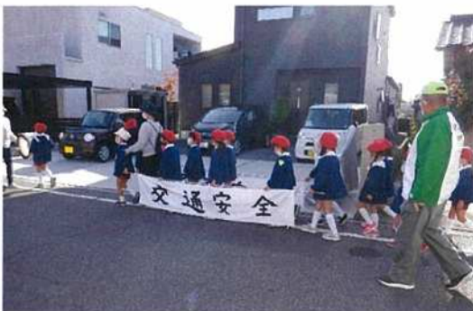
保育園児の交通安全パレードの様子

交通安全活動では、子供たちの登下校を見守り、交通事故撲滅に向けた誓いや保育園児の交通安全パレード「一斉子ども見守り隊」や、「交通安全運動の集い」を行っています。