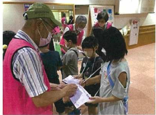
「子どもワクワクチャレンジ教室」の様子

また、「学園都市生徒と住民のふれあい祭」や「玉手箱ウォーキング」の開催、令和 4 年 8 月には、小学生だけを対象にした「子どもワクワクチャレンジ教室」を開催するなど健康づくり活動も行っています。