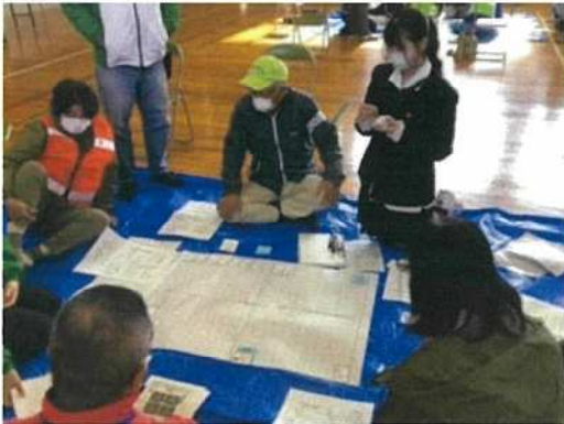
高校生と一緒に避難所運営ゲーム体験の様子

平成 19 年 1 月瀬戸町が岡山市と合併したことから、江西学区安全・安心まちづくり協議会を結成し活動を展開、今日に至っています。平成 24 年 6 月に瀬戸町合併特例区が解散したことにより会則の一部を改正し、名称を安全・安心ネットワークに変更しました。現在、連合町内会はじめ、学校関係・学区内で活躍する各種団体等 31 団体で構成されています。