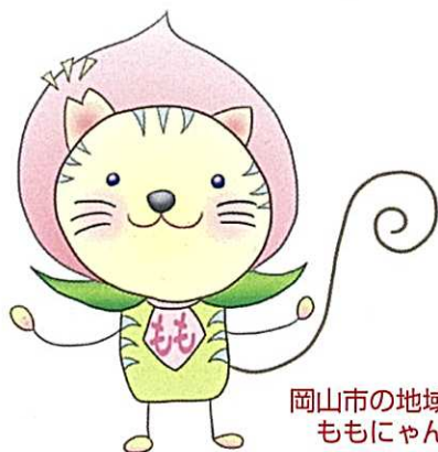
岡山市の地域猫 ももにゃん

「野良猫の被害を減らしたい」「不幸な猫を減らしたい」 地域猫活動なら解決できるかもしれません！