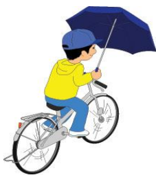
うんてん かささし運転