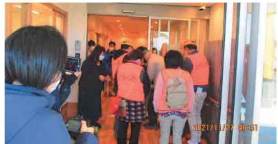
災害時避難行動要支援者避難訓練の様子