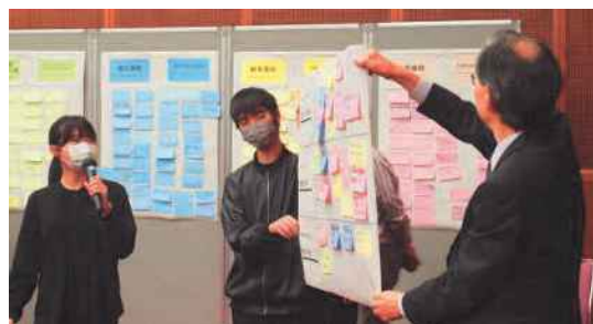
各グループからの意見発表