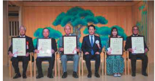
市民協働フォーラムにて行われた表彰式

岡山市危機管理室、岡山市保健福祉企画総務課、東区保健センター、民生委員、ケアマネジャー、特別養護老人ホーム「あお鳩の杜」、特別養護老人ホーム「多聞荘」