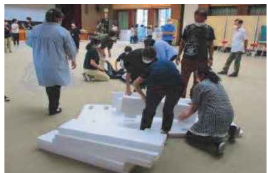
避難所運営リーダー養成研修会の様子