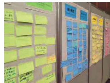
各取組への応援メッセージ