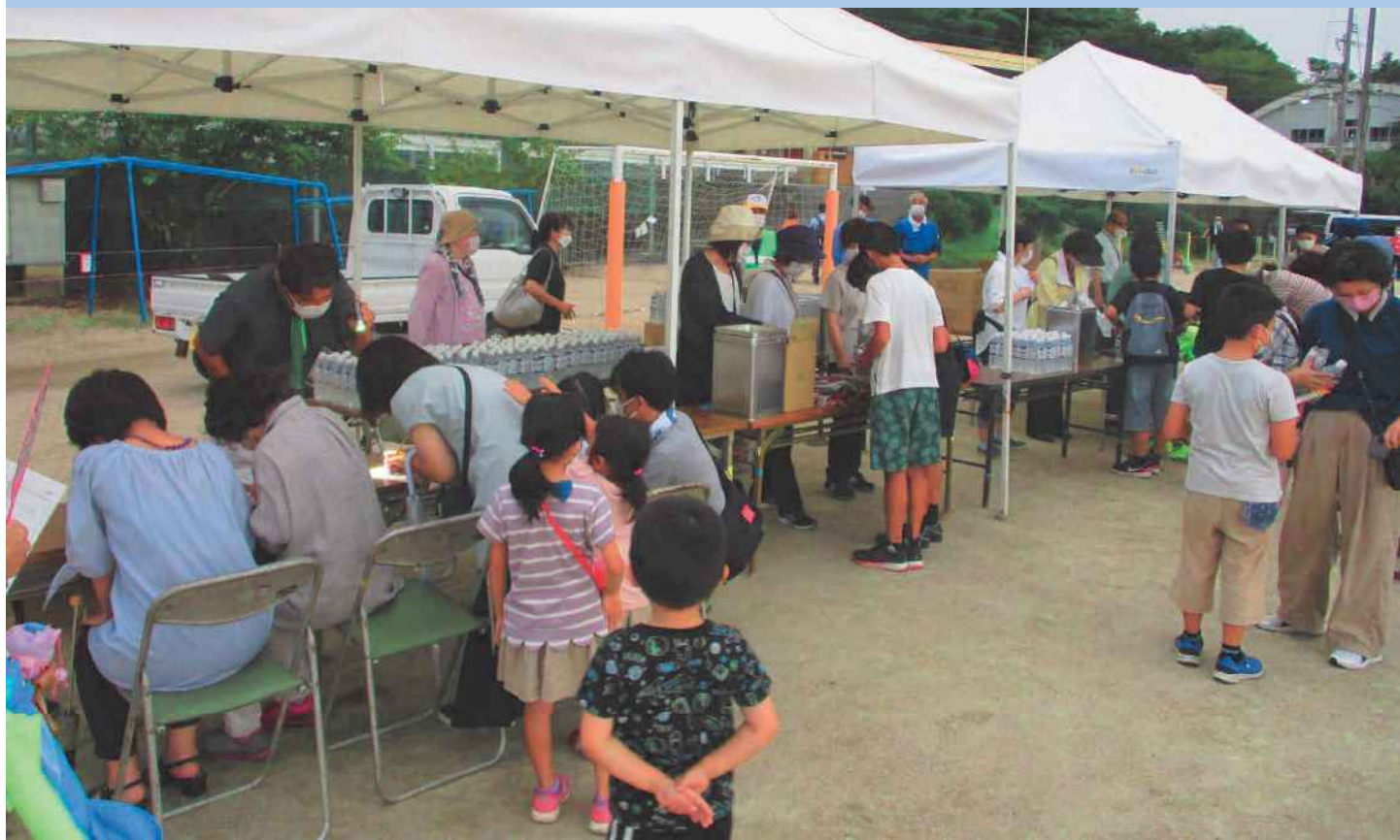
第8回「おかやま協働のまちづくり賞」にて大賞を受賞した『千種学区防災会』の取組の様子(避難訓練)