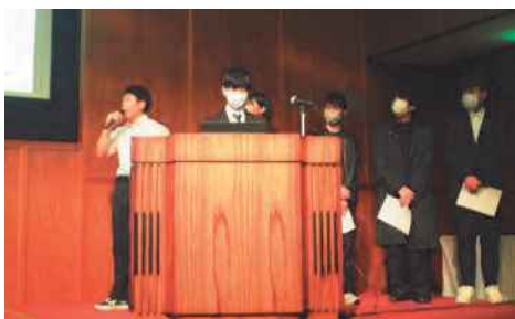
各グループからの取組発表