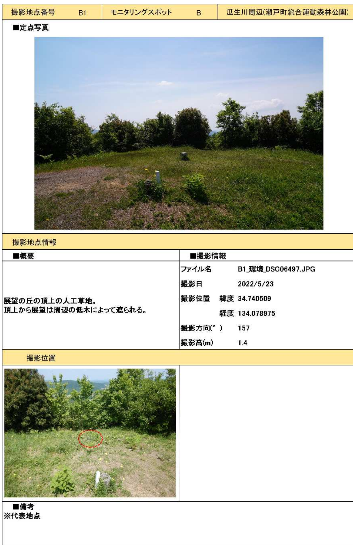
表 3-13 定点撮影地点 1/5