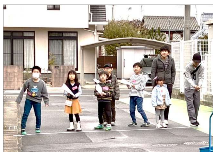
↑参加者の子どもたちが一列に並んで...! 「3.2.1...ティクオフ!!」

さん! この日のために 企画から準備を進めて きたサンプルメンバ ーは、参加者の案内から 受付、司会進行、運営ま ですべてを自分たちで やり遂げました。参加し た小学生たちへのサポ ートもとても上手で