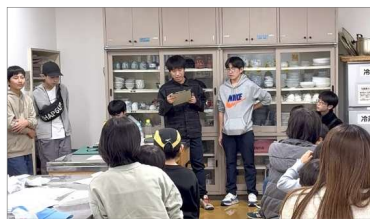
←すこし緊張しながらもカッコイイ司 会進行でした!

12月21日、お天気の心 配をしながら迎えた本番 当日でしたが、開始時間 は雨もあがり予定どおり 中山こども園側の通路で 開催することができまし た。参加者は、なんと17 組、約35名の親子のみな