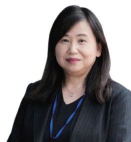
保健福祉局 保健福祉部 保健政策担当部長

岡山市では、「すべての市民が、病気や障害などの有無に関わらず生きがいを持ち活躍できる社会の実現」を目指し、取り組みをすすめています。保健師として、市民の声を丁寧に聞き、市民主体のまちづくりを様々な関係機関の皆様と協力して進めていくことは、とてもやりがいがあり楽しさもあります。ぜひ私たちと共に、健康で活力にあふれる岡山市を創り上げていきませんか。