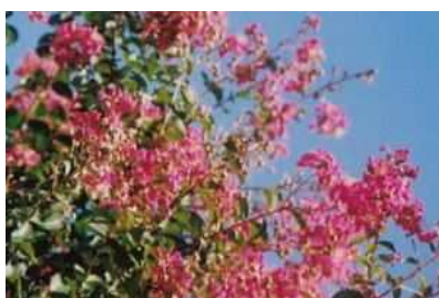
市の花木 サルスベリ