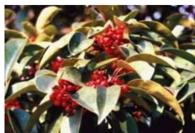
市の木 クロガネモチ(アクラ)