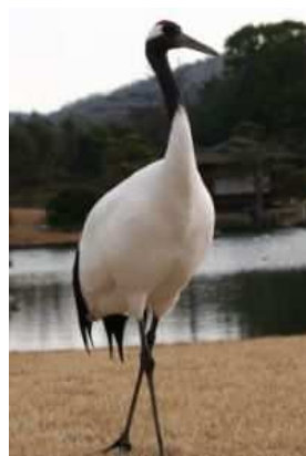
市の鳥 タンチョウ