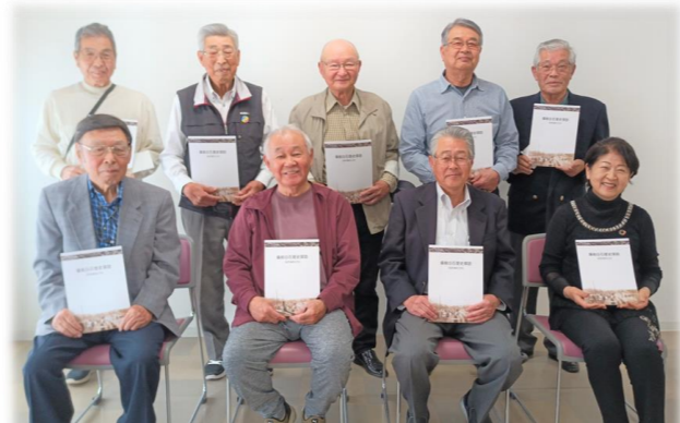
地元愛あふれる白石町内会の皆さん、ありがとうございました。

水害の被害も含めた白石の歴史を伝えるため、たくさんの方々に手に取っていただければうれしいです。