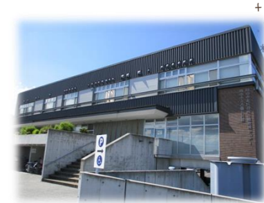
地域と歩む 吉備公民館 建て替え10周年♪

3月の吉備学区愛育委員会では、吉備の中山には100mを超える古墳が2つあること。この辺りは奈良の大仏ができる前までは、一面に海が広がっていたこと。1961年に児島湾締切堤防が完成するまでは田畑には塩害があり、用水路ではいろいろな海の魚が釣れていたこと。2018年の西日本豪雨では、3000軒あまりが浸水被害にあったことなど、「吉備中学校区の歴史」について話をさせていただきました。地域を学ぶことを通して「地域を愛する心」を育み、子どもだけでなく、大人も地域も、みんな元気になることを目指していきたくと思っています。その中で、地域づくりと歴史・文化の継承の中核となる次世代の育成にもつなげていきたくと思っています。