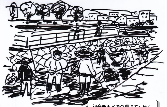
観音寺用水での環境てんけん

発行日 2023. 6. 1 編集発行 岡山市京山地区ESD推進協議会 地域の絆プロジェクト企画委員会 事務局・連絡先 Tel・Fax 086-253-8302