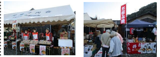
盛況なカモメ朝市の会場

11月4日、カモメ朝市に行ってきました。地元の野菜やさけ寿司をはじめKNDメダカや健康チェックのブースやトヨタの介護車両の展示、また多くのキッチンカーの出店がありました。天気もよく、多くの親子連れ・学生のグループ・年配の方々がいろいろのお店を楽しんでいました。いつもは静かな海辺の広場に楽しそうな声が響いていました。