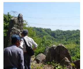
左端の岩が綱掛岩です