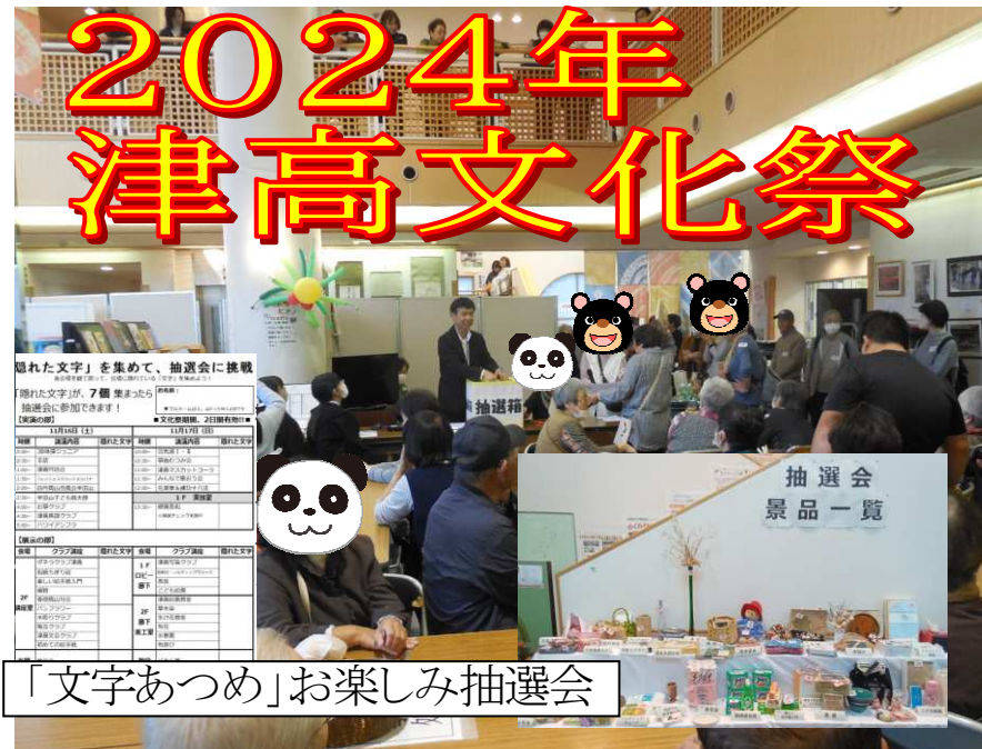
「文字あつめ」お楽しみ抽選会