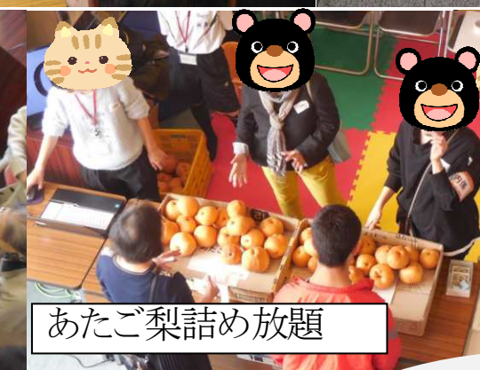
あたご梨詰め放題