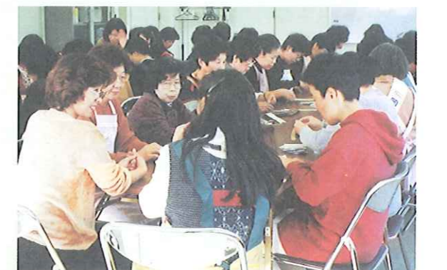
さつき会の人々と共に

保健婦さん、栄養士さん、看護婦さんたち11人がおられます。「今まで、西大寺管内の保健所ということで、住民の皆様にご親切にいただいていた。今年度から、岡山保健所に一本化されましたこと、お知らせが届いてない等ご迷惑をおかけしています。だんだん保健センターが身近な施設として親しまれるように、スタッフ一同頑張ります。」とおっしゃってくださいました。