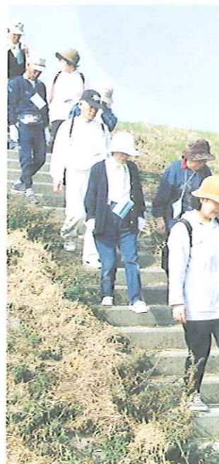
ウォーキングを楽しむ—富山地区

地域ぐるみで運動習慣をつけ、同時に友達もできて閉じこもり解消のきっかけになればと、愛育委員会は保健所、公民館、おやこクラブなどいろいろな団体とタイアップして、歩く会を行っています。