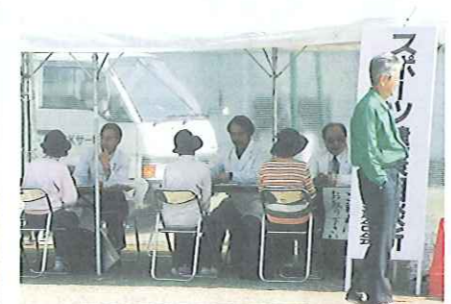
ウォーキングの前に健康相談を受けて—藤田地区