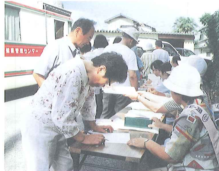
住民検診で受付をしている愛育委員

C地区愛育委員会では、自分の受け持ち町内の方々に、健康世帯台帳を元に対象者(15歳以上で学校や職場で受けるチャンスのない人)を調べ、個人受診票に住所・氏名を書いて検診日程表と共に各戸に配布し、受診のお勧めをしています。なにかの都合で検診車での検診を受けられなかった方には、再度お勧めをするようになって、現在は80~90%の人が受診されるようになりました。