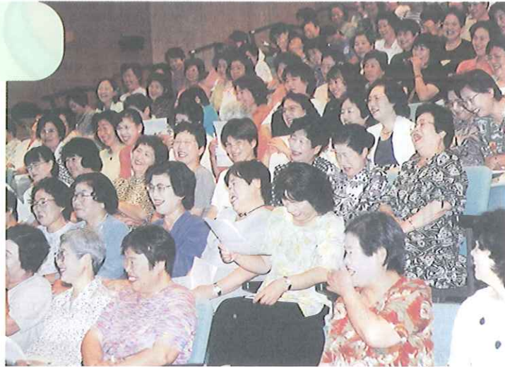
シンポジウムの風景

「結核は過去の病気、心配ない病気と思っていたが、考えが変わった」「早期発見によりほとんど治るので検診の大切さがよく分かった」「今後、胸部レントゲン検診を毎年受けるよう、地区の人々を誘いたい」等々シンポジウムに参加した人たちの感想がありました。とくに、若い愛育委員に結核を知ってもらうのに役に立ちました。