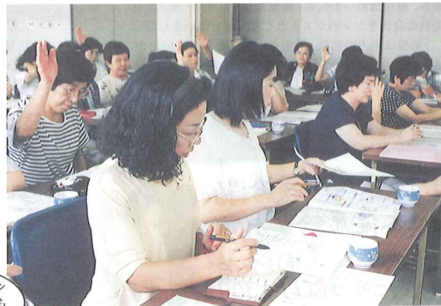
各地区で結核研修

クイズをしたり、グループ討議をしたり、わきあいの雰囲気の中、改めて結核についての関心が低いことを知りました。