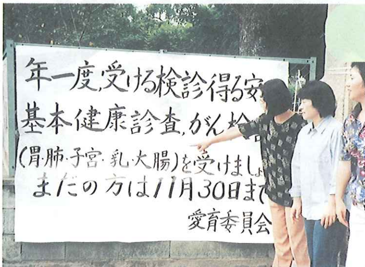
運動会で健康診査を呼びかける愛育委員(本文と写真は関係ありません)

ところが、小学生のお孫さんが結核と診断され、感染経路を調べてみると、同居のおじいさんの風邪が長引き