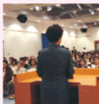
平成20年度 岡山市愛育委員協議会母子保健研 (7/20.19)

子育て中の母親やおやこ(山梨県立大学 非常勤講師)を大切にできる人間の育成を300余名が参加し、母子保健しました。