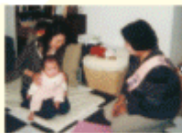
現在の愛育訪問の様子

核家族化等による 育児不安を、少しで も解消してもらあ うと子どものいる 家庭を支援する、愛 育訪問が始められ ました!