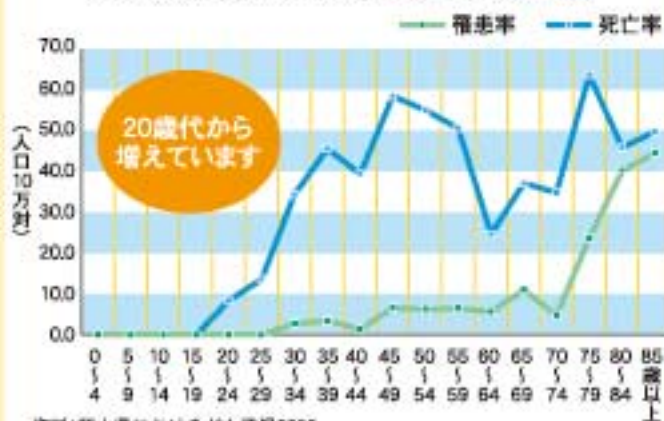
岡山県の子宮がん罹患率と死亡率(2003年)