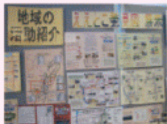
愛育活動の紹介コーナー