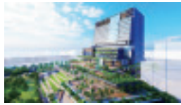
このイメージパースは実施設計時点のものですが。