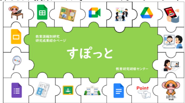
教育課題別研究 研究成果紹介ページ「すぽっと」

なお、平成24年度から取り組んできた「教育課題別研究」における成果物は、ひきつづき岡山市教育研究研修センターHP内の「すぽっと」から閲覧できます。適宜、ご活用ください。