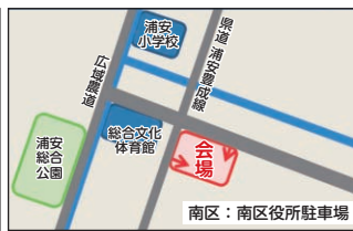
南区役所駐車場 (南区浦安南町)