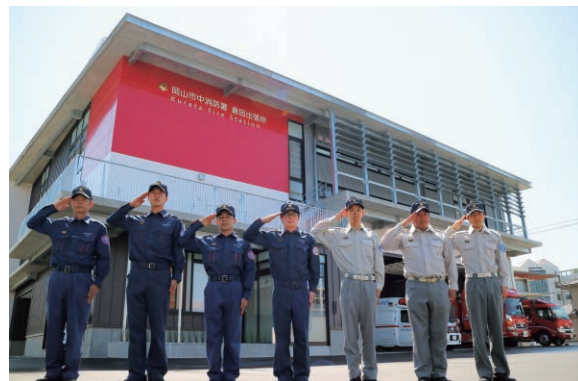
▲岡山市中消防署倉田出張所

住宅化が進んでいる国道2号線より南の中区南部地域への消防サービスの均衡化を図るとともに、消防ポンプ車・水そう付きポンプ車・高規格救急車を配備し、地域の防災拠点施設として市民の皆さんの「安全・安心なまちづくり」に取り組んでいきます。