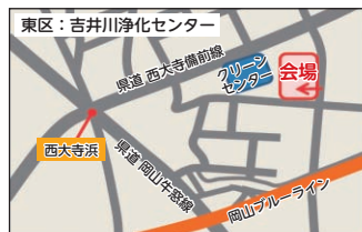
吉井川浄化センター (東区西大寺新地)