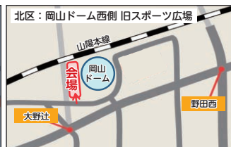
岡山ドーム西側 旧スポーツ広場 (北区北長瀬表町一丁目)