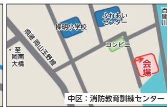
消防教育訓練センター (中区桑野)