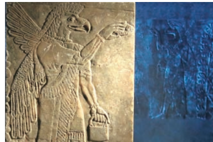
▲アッシリアレリーフ 石灰岩 2900年前頃