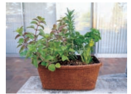
D ガーデニング講座