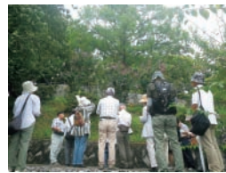
B 四季と自然を楽しむ会