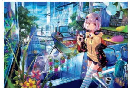
藤ちょこ 理想のマイルーム