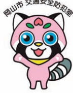
岡山市交通安全キャラクター「まもも」