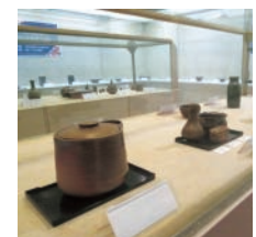
▲やさしい備前焼講座の作品