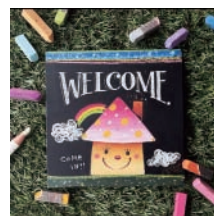
▲チョコレートでウェルカムボード作りの作品例

南ふれあいセンター ちょっと素敵な映画会 父と暮らせば 日 4月18日(日)①10時〜11時40分②14時〜15時40分 定 各回先着100人