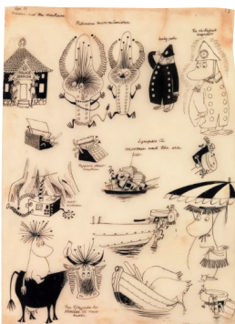
トーベ・ヤンソン「まいごの火星人」スケッチ（1957年）©Moomin Characters™