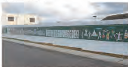
▲工事現場の塀を彩る作品