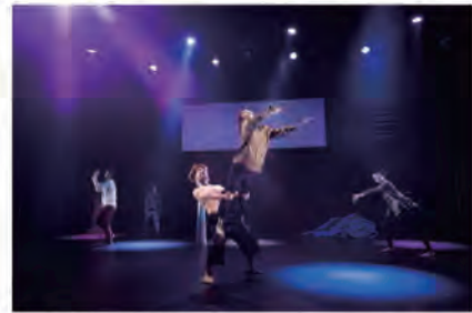
▲Baobab公演写真

9月26日(日)13時~ 西川アイプラザ(北区幸町) 前売2,000円 作品名 Baobab Re:born project vol.2「アンバランス」 発売日 7月18日