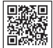
岡山がんサポート 情報HP

がんに関する相談窓口として、市内7カ所にごん相談支援センター（がん診療連携拠点病院などに設置）があります。診療の有無に関係なく、どの病院でも無料で相談できます。