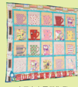
東日本大震災復興 応援キルト