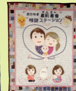
子育て応援キルト