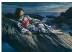
▲塩谷亮「青昏」2020年 ホキ美術館