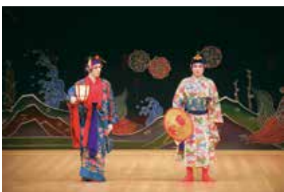
▲国立劇場おきなわ 組踊『執心鐘入』（2021）