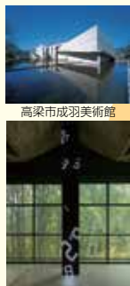
高梁市成羽美術館 宮島達男《Counter Falls》2018 Installation view in the exhibition Sky of Time (2019-2020) at EMMA - Espoo Museum of Modern Art / Saastamoinen Foundation