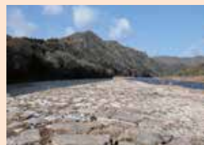
▲除草・土砂撤去時の井堰

旭川が備前と美作の国境をなしていたことから、川の中央で途切れた片持式の特異な構造の斜め堰となっています。全長650mの堰は、現存する日本最大の農業用の石造取水堰で、現役でありながら江戸初期の姿を良好な状態で保っています。