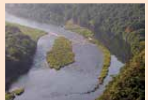
▲旭川上流から見た井堰全景