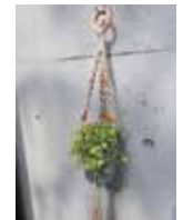
C プラントハンガーをつくろう

瀬戸町 〒709-0856 東区瀬戸町下188-2 ☎/☎086-952-4531 開館時間 10時~18時 休館日 月曜、第2日曜、祝日