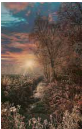
▲原雅幸「冬のアンジェリカ」2020年 ホキ美術館