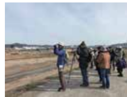
B 里山のバードウォッチング