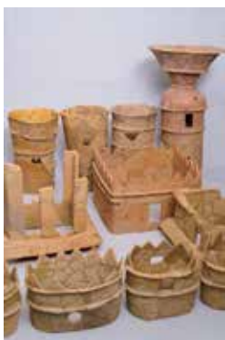
▲金蔵山古墳出土埴輪 吉備の大古墳展