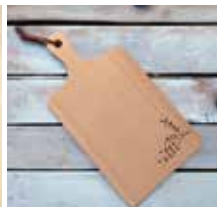
▲磨いて作るブレッドボード