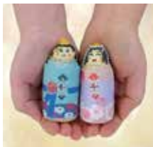
▲ミニおひな様にお絵かき