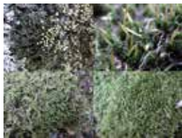
A 半田山自然塾 植物園でコケを探せ!