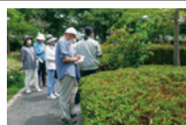
A 公園の植物みてあるき