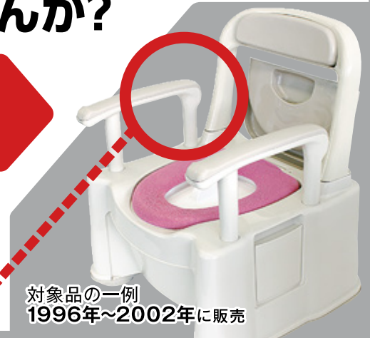
対象品の一例 1996年～2002年に販売