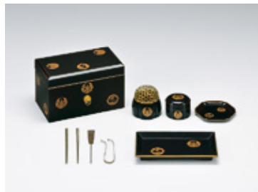
▲輪蝶祇園守紋蒔絵婚礼調度 香道具（林原美術館蔵）