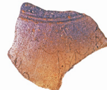
▲鳥装人物絵画土器