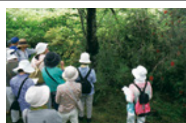
B 四季と自然を楽しむ会