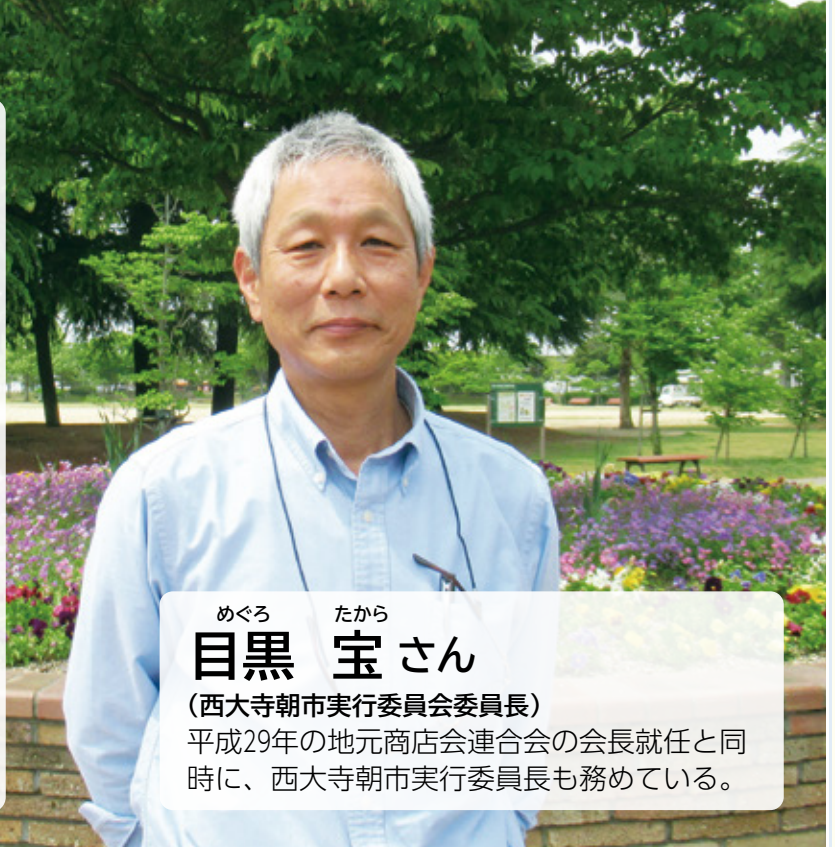
めぐろ たから 目黒 宝さん

地域の出店者や住民の皆さんにとって、「コミュニティーの場」となればと思っています。