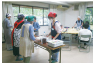
▲東山つながりキッチン

ボランティアに参加した大学生からは、「子ども食堂の存在は知っていたが、身近になく、実際にどのよ