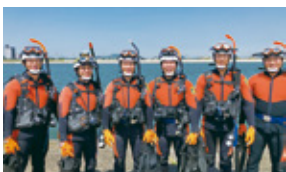
▲南消防署水難救助隊

南消防署には、水の事故全てに対応する水難救助隊が配置されています。災害に応じて、潜水救助資器材を積んだ水難救助車や水上バイク、水陸両用バ