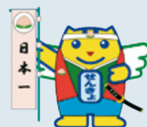
選挙のめいすいくん (ももたろうめいすいくん)