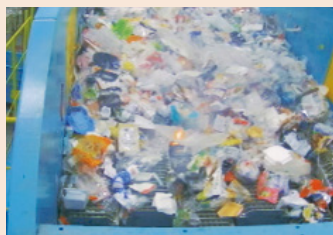
▲処理施設での発火の様子

リチウムイオン電池には、衝撃を加えると発火するという性質があります。誤って可燃ごみや不燃ごみ、プラスチック資源として捨てると、収集車や処理施設の機械が故障することはもちろん、収集車を運転する人や、処理施設で働いている人にとって大変危険です。