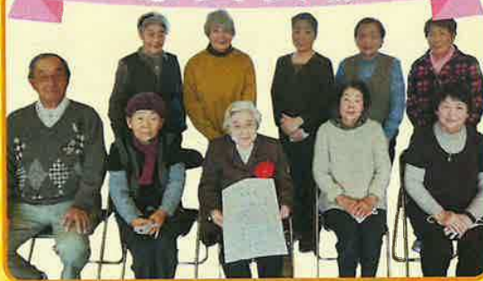
あっ晴れ! もも太郎体操 参加者表彰