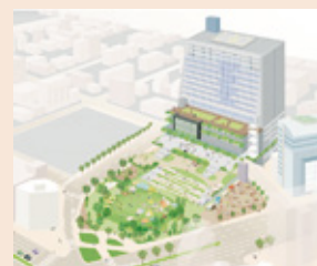
完成後のイメージ

令和8年度の供用開始を目指して、市役所新庁舎を建設中です。供用開始後は、現在の本庁舎を解体し、その跡地に大供公園・庁舎前広場などを整備する予定です。整備の参考とするため、大供公園・庁舎前広場の活用方法などについて、アンケートを実施します。ご協力をお願いします。