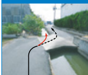
④カーブ外側の用水路