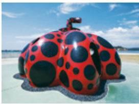
草間彌生「赤かぼちゃ」(2006年) 直島・宮浦港緑地