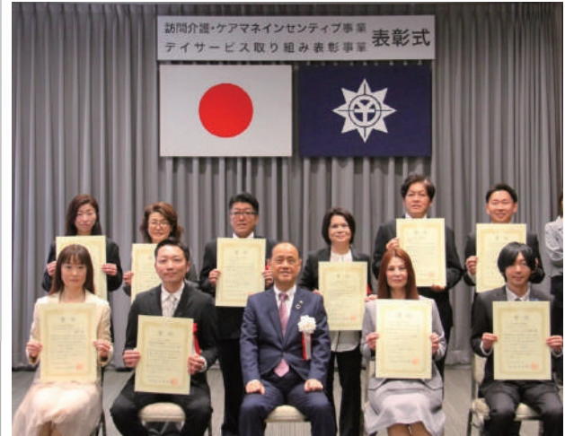
デイサービス取り組み表彰事業