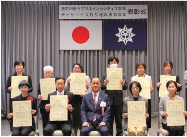
総合特区訪問介護インセンティブ事業