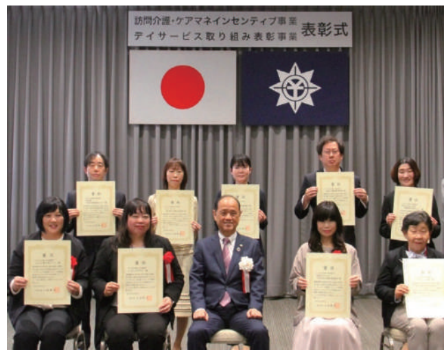
総合特区ケアマネインセンティブ事業