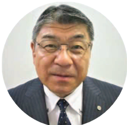
教育長 三宅 泰司